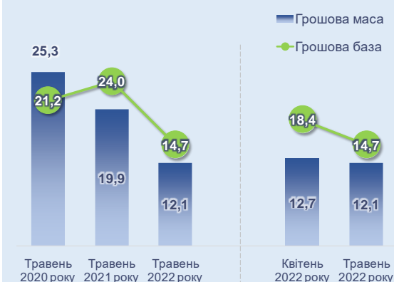
Рис. 9 Зміни грошової маси та бази, % у річному обчисленні