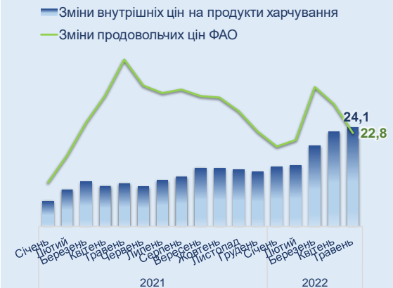
Рис. 5 Зміни цін на продовольство, % у річному обчисленні