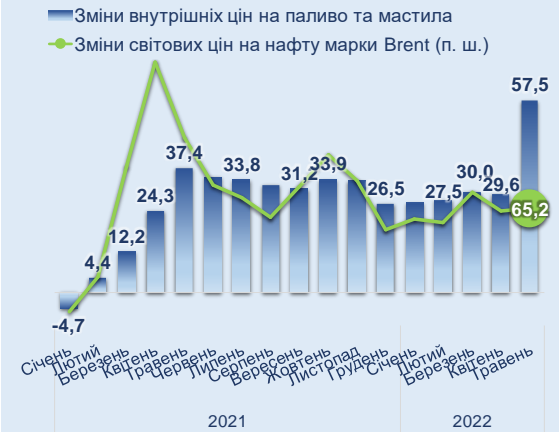
Рис. 4 Зміни цін на паливо, % у річному обчисленні

Довідково. Упродовж травня, як і в попередні місяці, в умовах воєнного стану, офіційний курс гривні до долара США залишається незмінним – на рівні 29,25 грн/дол. США, хоча ринкові коливання готівкового обмінного курсу створювали передумови для підвищення цін упродовж наступних місяців. Зокрема, середньозважений курс «продажу» готівкової гривні до долара США послабився на 11,5% до 35,81 грн/ дол. США на кінець травня.