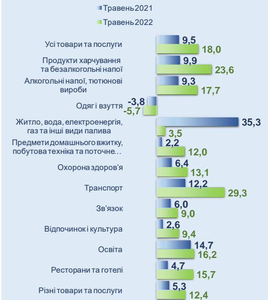
Рис. 2 Зміни споживчих цін за розділами товарів та послуг, % у річному обчисленні