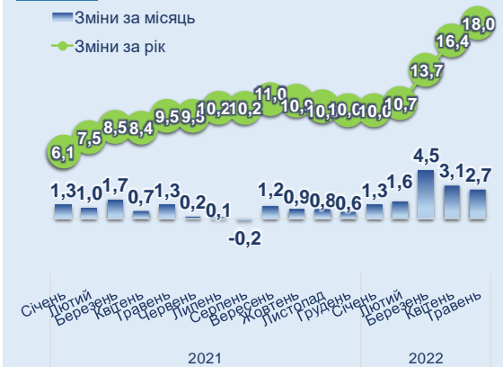
Рис. 1 Зміни споживчих цін, %