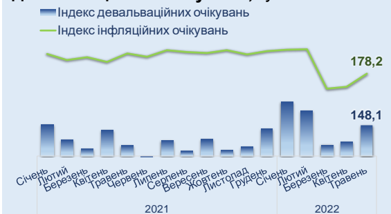
Рис. 3 Індекси інфляційних та девальваційних очікувань, пунктів