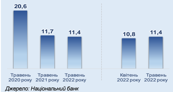
Рис. 11 Строкова структура депозитного портфеля домашніх господарств (на кінець періоду), %