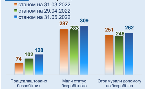
Рис. 7 Ринок праці, тис. осіб

Поточна монетарна політика Національного банку – створення якоря стабільності шляхом фіксації офіційного обмінного курсу гривні до долара США та жорсткий контроль за грошовою