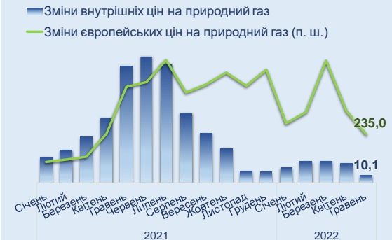
Рис. 6 Зміни цін на природний газ, % у річному обчисленні