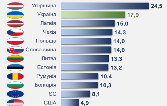
Рис. 2 Зміни (гармонізованих) споживчих цін деяких країн та України у квітні 2023 року, % у річному обчисленні