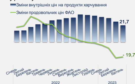
Рис. 5 Зміни цін на продовольство, % у річному обчисленні