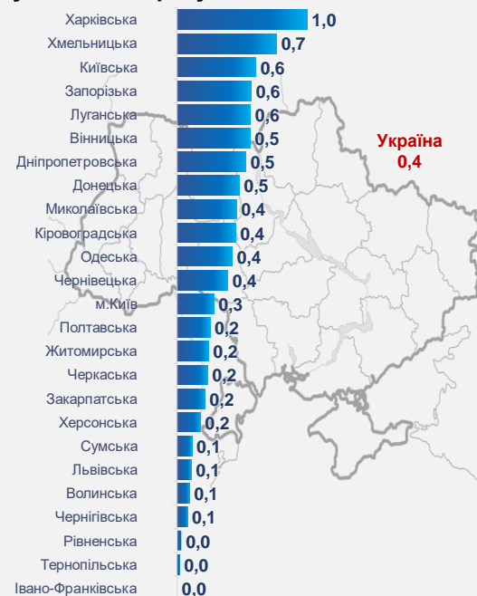
Рис. 4 Зміни цін на продукти харчування та безалкогольні напої за регіонами у квітні 2023 року, % за місяць