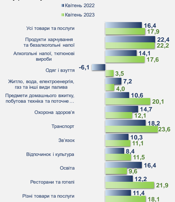
Рис. 3 Зміни споживчих цін за розділами товарів та послуг, % у річному обчисленні