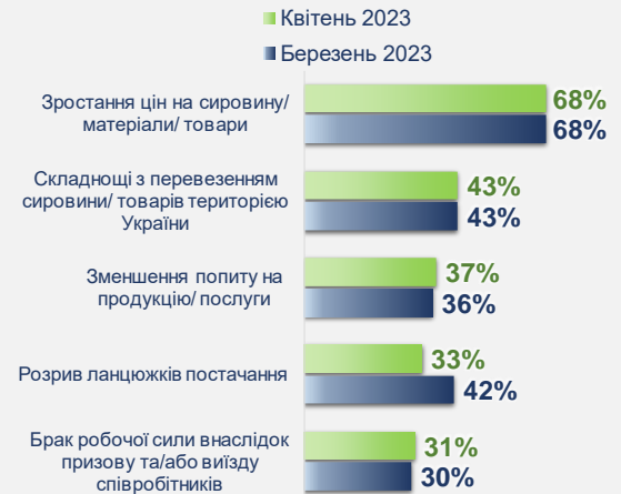
Рис. 7 Топ-5 найважливіших перешкод для ведення бізнесу