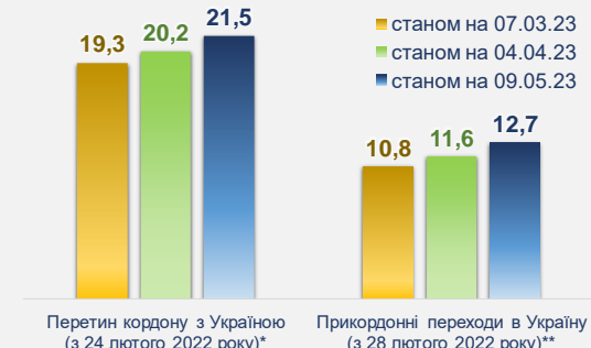
Рис. 8 Кількість населення, які перетнули кордон України, млн

*вiдображає транскордонні переміщення (а не фізичних осіб) 3 18 по 23 лютого до рф з Донецької та Луганської областей переїхали ще 105 тис. осіб.