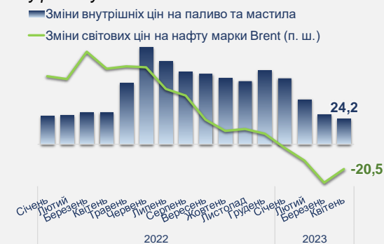
Рис. 6 Зміни цін на пальне, % у річному обчисленні