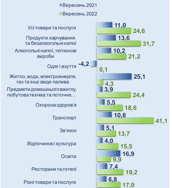
Рис. 2 Зміни споживчих цін за розділами товарів та послуг, % у річному обчисленні