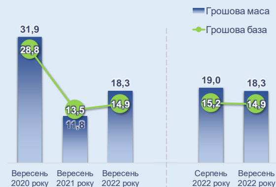
Рис. 12 Зміни грошової маси та бази, % у річному обчисленні

Головним ризиком перманентних сплесків різкого зростання цін залишається війна, особливо зважаючи на посилення агресії та обстріли критичної інфраструктури, що через спричинені руйнування впливатиме на динаміку виробничого сектору та, відповідно, провокуватиме нові шоки пропозиції товарів та послуг на внутрішньому ринку.