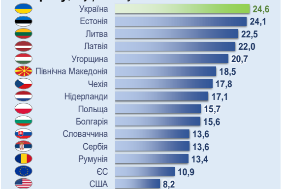
Рис. 3 Зміни (гармонізованих) споживчих цін деяких країн та України у вересні 2022 року, % у річному обчисленні