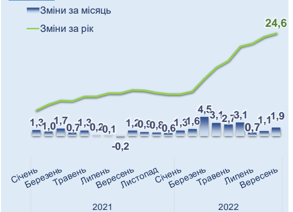
Рис. 1 Зміни споживчих цін, %

Водночас, як і раніше, переважними чинниками інфляції залишаються: тимчасова втрата частини території; порушення