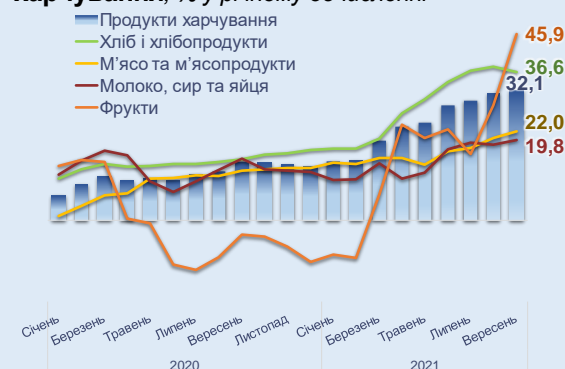
Рис. 6 Зміни споживчих цін на продукти харчування, % у річному обчисленні

Відтак у частини населення через певне відновлення доходів поступово зростає можливість щодо використання коштів на товари відкладеного попиту, що надало ціновий імпульс насамперед непродовольчим товарам.