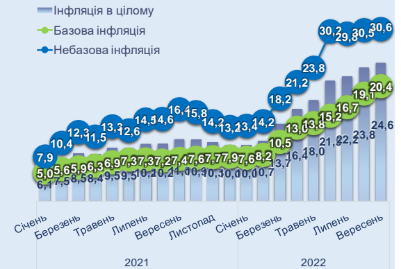
Рис. 4 Базова та небазова інфляція, % у річному обчисленні