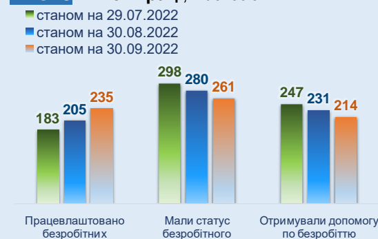
Рис. 8 Ринок праці, тис. осіб