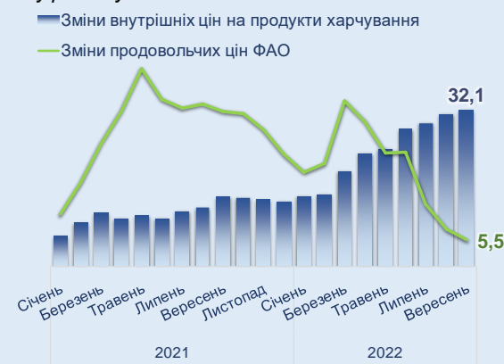
Рис. 7 Зміни цін на продовольство, % у річному обчисленні