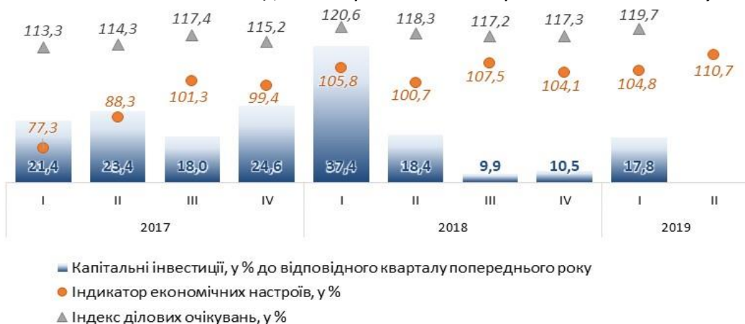
Рис. 4. Капітальні інвестиції, індикатор економічних настроїв та індекс ділових очікувань, %

За даними НБУ, у I кварталі 2019 року індекс ділових очікувань становив 119,7% (у I кв. 2018 р. 120,6%), зокрема підвищились очікування респондентів у наступні 12 місяців щодо загального обсягу реалізації продукції власного виробництва (34,4% за I кв. 2019 р., проти 32% і I кв. 2018 р.) та фінансово-економічного стану (20,8% проти 19,6%).