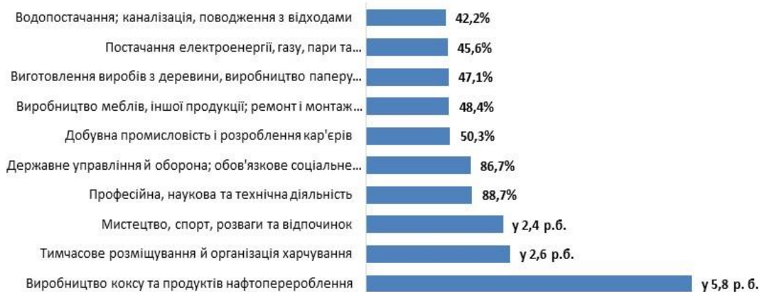
Рис. 2. ТОП найвищих темпів зростання за I квартал 2019 року освоєних капітальних інвестицій за видами промислової та економічної діяльності, %

Довідково. Відповідно до договору ПАТ “Дніпровський металургійний комбінат” з ПрАТ “Дніпровський коксохімічний завод”, останньому були передані у власність силовий трансформатор, доменна піч №9, доменна піч №1М, доменна піч №12. Загальна вартість майна без ПДВ становить 333,8 млн. грн. ПрАТ “Дніпровський коксохімічний завод” платежами від 14.02.2019 року та від 15.02.2019 року сплатив повну вартість придбаного за договором майна – 400,6 млн. грн. Джерело. oligarh.media